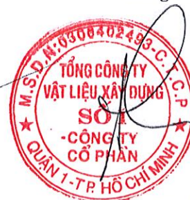
Cao Trường Thọ