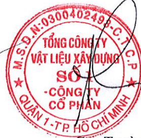
Cao Trường Thọ